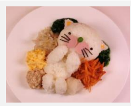
江戸東京野菜の ビビンバ

http://dent-hosp.ndu.ac.jp/nduhosp/tama-clinic/10_5680ac630c03e/index.html