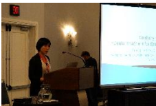
日本の摂食の現状を報告