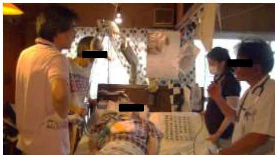
様々な職種の方に立ち会っていただき、検査を行っています

多摩クリニックでは在宅や施設に入居されている患者さんに、訪問診療を行い、食べることの支援を行っています。本号では、在宅訪問診療についてご紹介します。在宅訪問診療は、食べる・飲み込む機能に障害がある方、疑われる方に対して、歯科医師、歯科衛生士で食事の状況や口腔機能の検査を行い、ご家庭での安全な栄養摂取方法の設定、及び必要な訓練の指導を行います。その際、全身状態把握のためにも主治医の先生からの診療情報提供書、または摂食嚥下リハビリテーション依頼状を前もっていただいていると、診療をスムーズに開始することができます。また、ご家族はもちろん、訪問主治医の先生、介護支援専門員や訪問看護師など関連職種の方々に検査時同席いただくことで医療連携が図れますので、可能な限りご同席いただくようお願いしています。同席いただけない場合も後日情報提供を行い、誤嚥を防ぎ、疲労を少なく食事をするためにはどのような食事方法が最適か、ご本人に合った方法をご提案します。食事の内容や食形態の指導に関しては、管理栄養士も参加し栄養指導などを行っております。