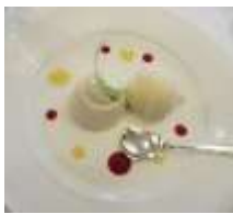
デザート(ジャスミンティーのモワルーパーニラアイスクリーム添え)