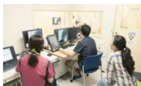
VF検査 保護者も一緒にみれます