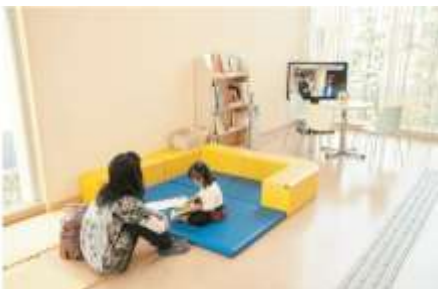
待合室 ~リラックスして待ってね

2回目からが本格的な摂食指導の始まりです。経口摂取ができる場合は、普段食べているのと同じような食べ物を持参していただき、食べる場所を観察して評価します。経口摂取ができない場合には、食べ物を使わない間接訓練を中心に行っていきます。また全身状態が重度で医科的チェックが必要な場合は、非常勤の小児科医が同席します。このように、お子さんの状態に合わせて指導の体制を組んでいきます。