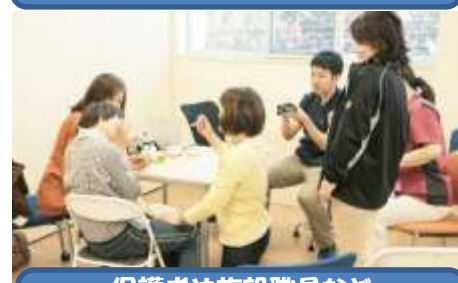
保護者や施設職員など 生活を支えるみなさんと一緒に 指導します