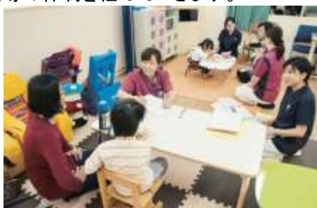
摂食指導室での様子