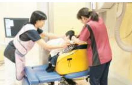
精密検査が必要！ VF検査へ