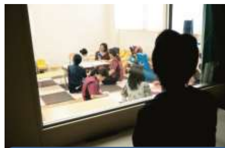
子どもが緊張してしまう、、 観察室から観察します