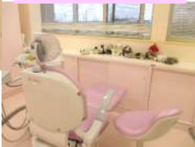
スペシャルニーズ診療室 (診療室4)